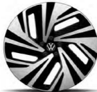
NARVIK 21" en negro torneado brillante PJ4/PJ6