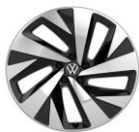
DRAMMEN 20" en negro PJ3