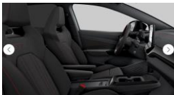
Interior PBK - tapicería UG PZ (GTX)